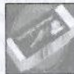
Bombe niveau 2